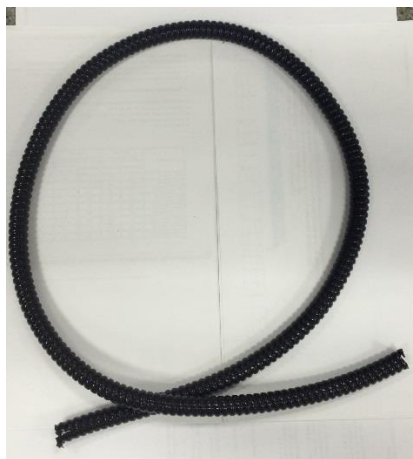
Рисунок 1 – Имитация металлорукава в бухте

4.1.3. После подготовки образцов поместить их в климатическую камеру симитировав их положение в бухте (рис. 1)