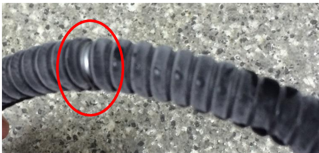
Рисунок 3 – Разрушение изоляции при оборачивании металлорукава МРПИнг Nord вокруг оправки против направления навивки бухты